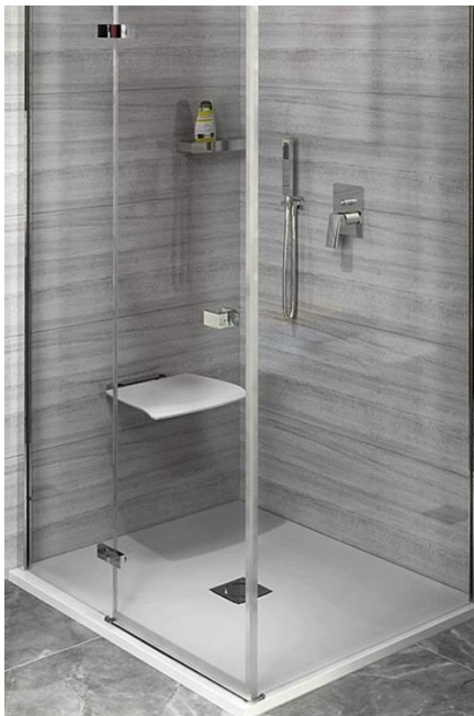
KARIA sprchová vanička z litého mramoru, obdélník 90x80x4cm, bílá Značka: Polysan Materiál: litý mramor