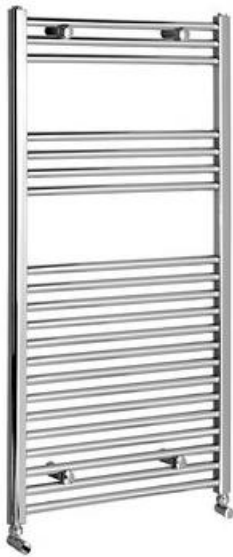
Elektrická topná tyč s termostatem, rovný kabel, 400 W, chrom Značka: Aqualine Materiál: Chrom